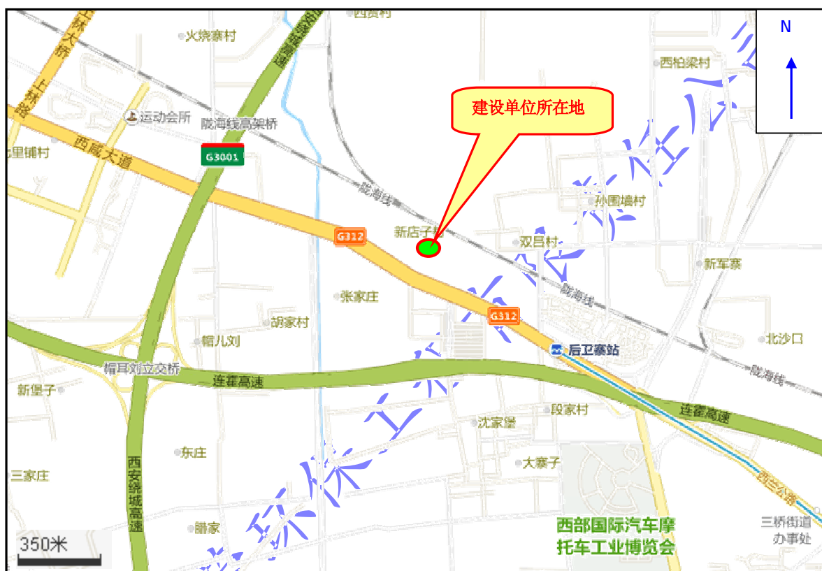
图 8-1 建设单位所在地

本项目为探伤机流动式无损检测项目，不建设专用探伤室。陕西泰诺特检测技术有限公司位于西安市沣东新城三桥镇新店村4区9排10号，地理位置见图8-1。