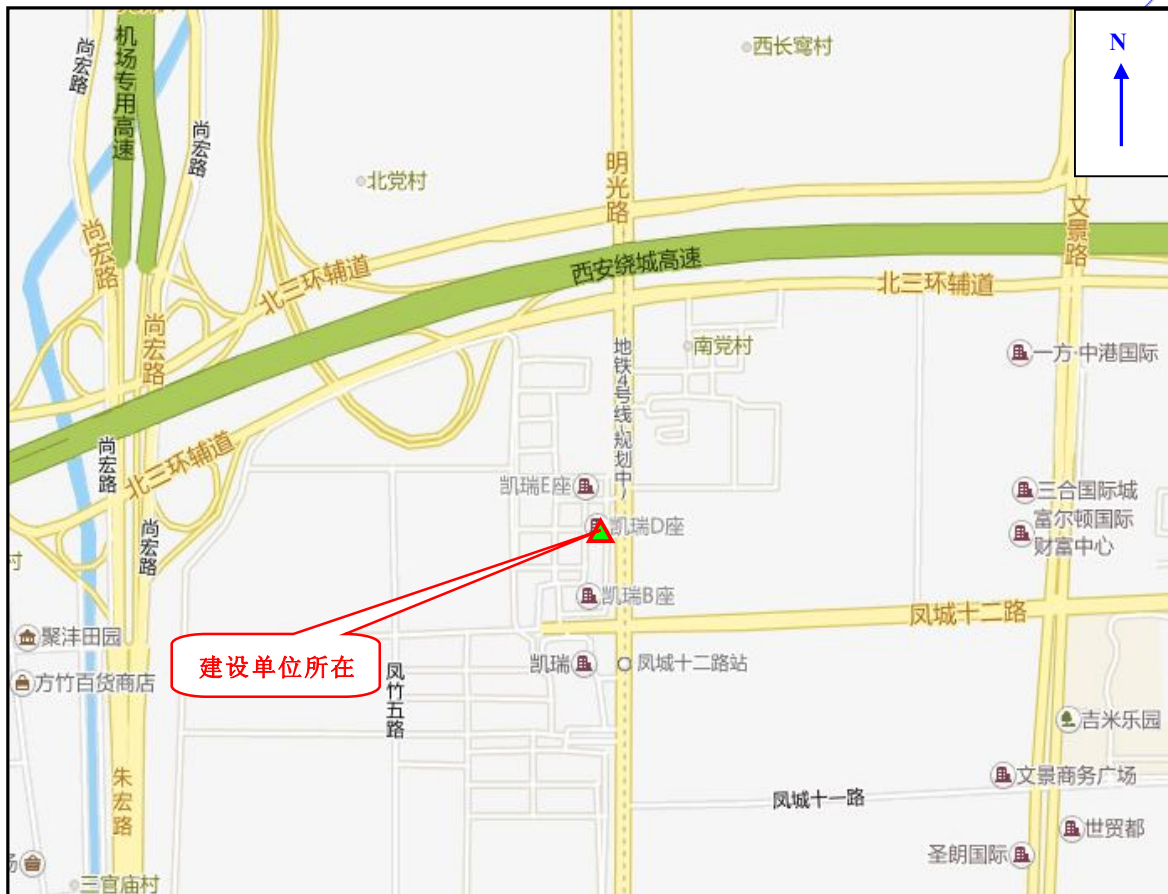
图 1 建设单位地理位置图